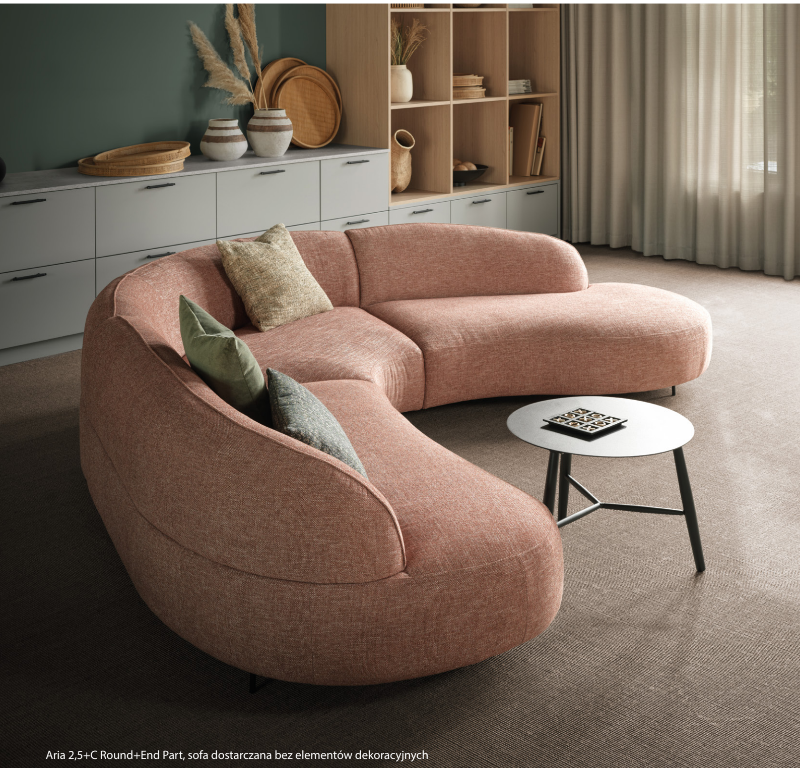
Aria 2,5+C Round+End Part, sofa dostarczana bez elementów dekoracyjnych