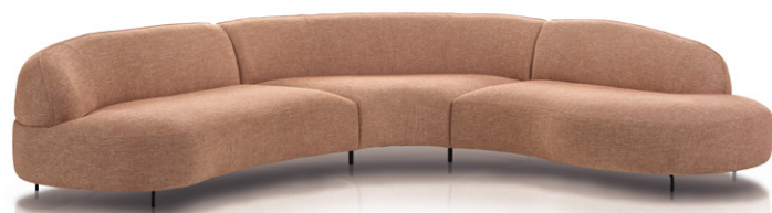
Aria 2.5+C Round+End Part