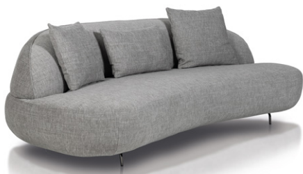
Aria 3, sofa dostarczana bez elementów dekoracyjnych